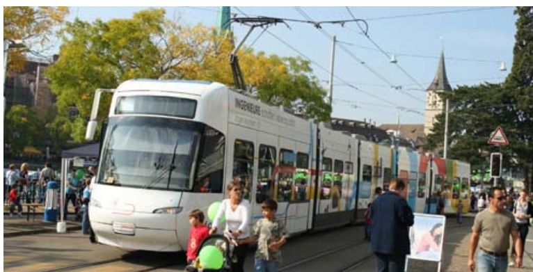
Ingenieurtram: Auf Zürcher Gleisen unterwegs ( www.ingenieurtram.ch )

Zusammen mit den Verantwortlichen für das Ingenieur-Tram, das auf Zürcher Schienen unterwegs ist, werden ab 2010 Veranstaltungen zum Thema Bau geplant. Im und ums Tram wird mit Kurzfilmen, Begleitveranstaltungen und Führungen auf Innovationen in diesem Bereich aufmerksam gemacht.