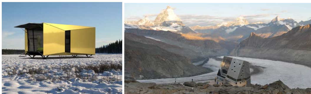
Energieautarke Raumzelle 'Self' und Neue Monte Rosa-Hütte an der Swissbau 2010: Prototypen für das Bauen der Zukunft