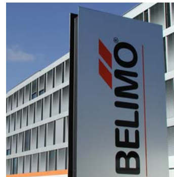
Hauptgebäude der Belimo in Hinwil (2002): Verbrauchsanalyse 2006 bestätigte hohe Energieeffizienz