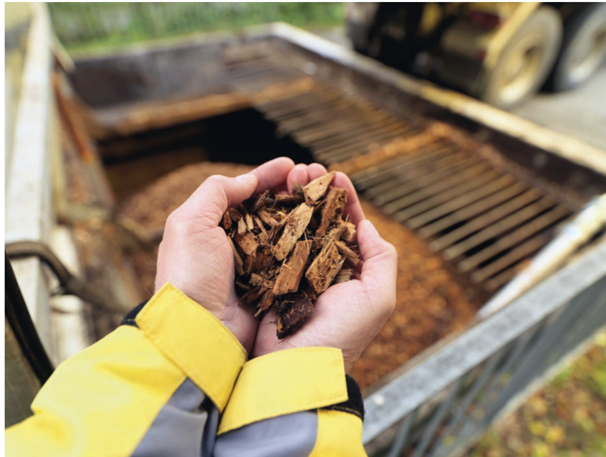
Holzschnitzel? Mit einem Tool wird das ideale Energiesystem eruiert.

Die erneuerbaren Energien werden in der Energiebilanz konsequent berücksichtigt. Dies entspricht dem «Umsetzungskonzept für die 2000-Watt-Gesellschaft».