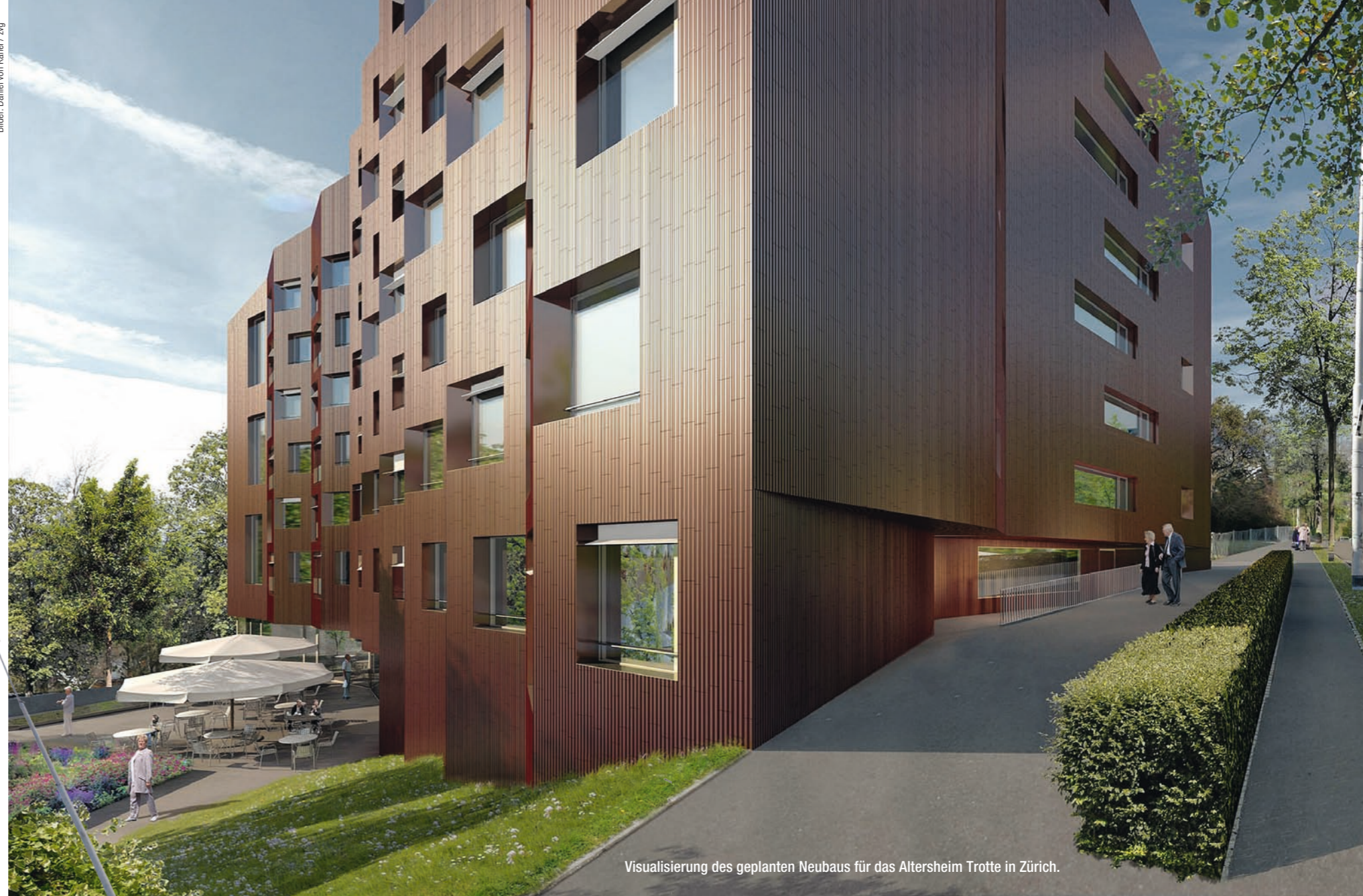
Visualisierung des geplanten Neubaus für das Altersheim Trotte in Zürich.

Das bisherige Gebäude des Altersheims Trotte soll einem Neubau weichen.